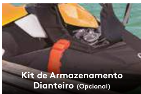
Kit de Armazenamento Dianteiro (Opcional)

Duas opções de motorização Rotax® econômicas, leves e compactas.