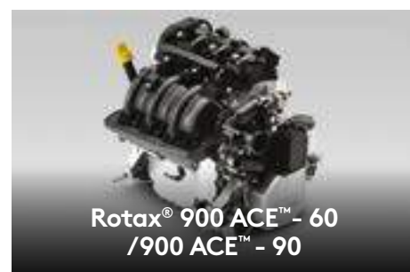
Rotax® 900 ACE™ - 60 /900 ACE™ - 90

Material inovador que reduz o peso, otimizando o desempenho e eficiência. O tingimento do material na moldagem é mais resistente à riscos que fibra de vidro.